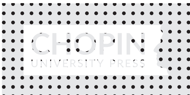
Logo umieszczone na tle innych elementów graficznych