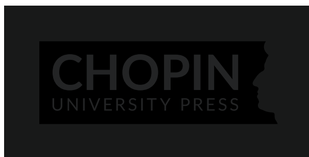
Czarne logo na bardzo ciemnym tle.